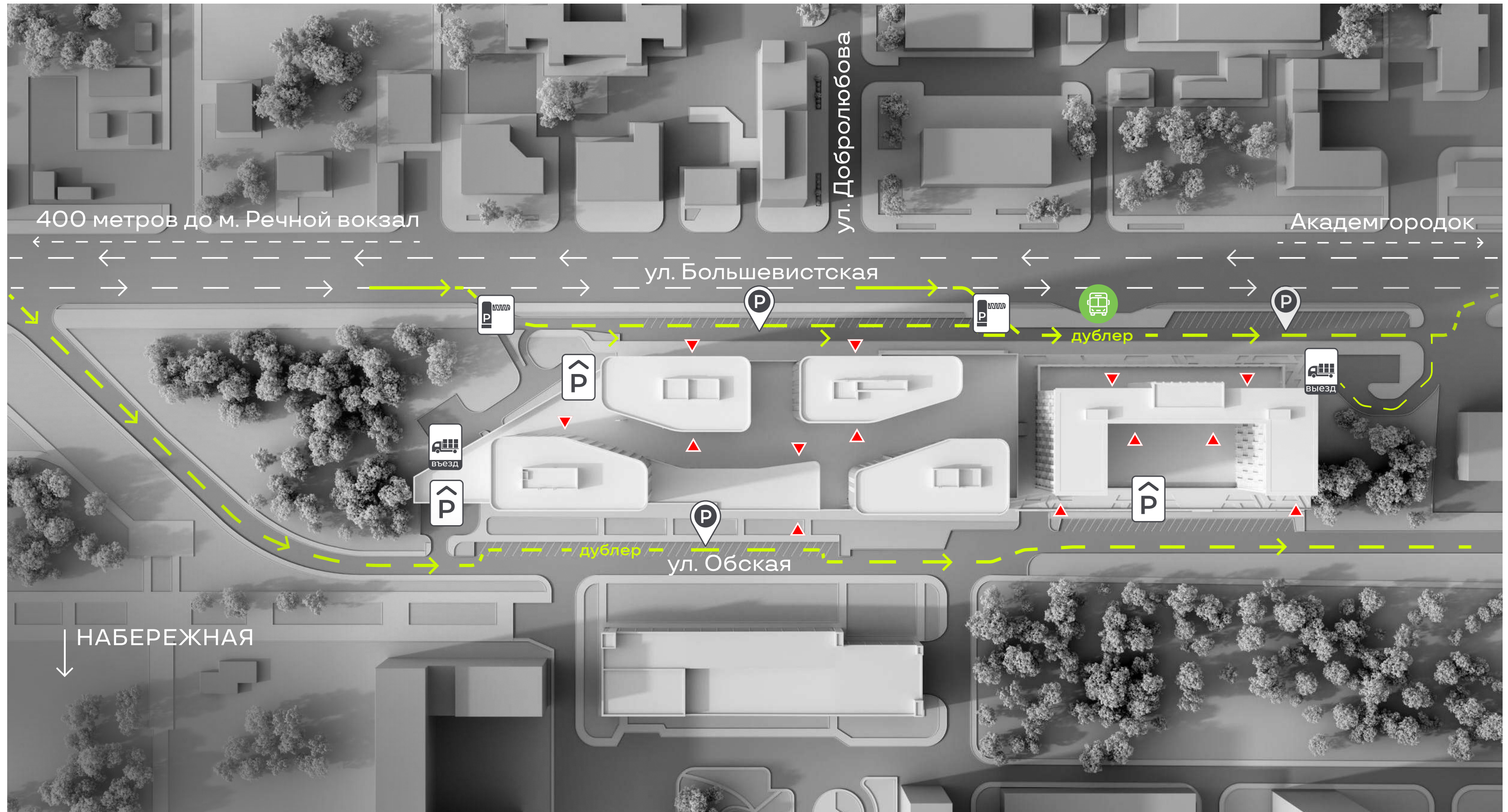
Схема автомобильного транспорта